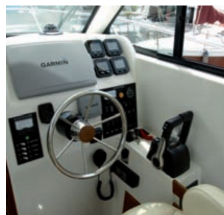
La consola deja un amplio espacio para añadir una pantalla multifunción en el centro.

les, correderas, complementadas por las puertas de popa ayudan en la ventilación de la cabina, aunque todavía se puede añadir una escotilla en el centro del hard top.