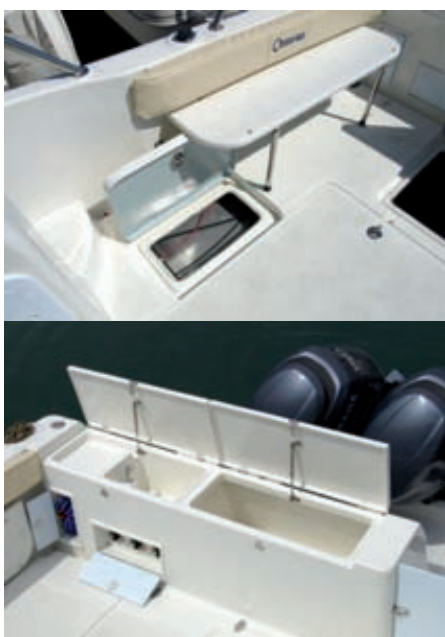
La tapa lateral podría quedar permanentemente cerrada. En el espejo de popa se ha previsto un grupo de agua a presión, vivero y lavamanos.

tifunción, por ejemplo, ordena correctamente los indicadores de los dos Yamaha, el cuadro eléctrico y el compás en la parte superior. Las palancas de los dos Yamaha, con el power trim integrado en la parte interior, fácil de pulsar, están perfectamente ubicadas, y no falta una pequeña guantera para depositar objetos personales. Destaca la dirección hidráulica de serie y la buena visibilidad desde la posición del piloto. No obstante, llama la atención, sin embargo, el asiento monoplaza, con el reposapiés integrado en su pata. No es habitual encontrar una silla así en un barco de este tipo. En este modelo, con menor anchura en la cabina, sería bueno buscar una alternativa, ya que esta pieza resulta demasiado grande. Las ventanas latera-