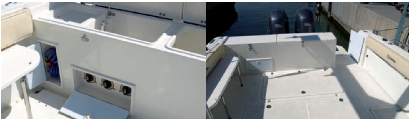
Entre los detalles de la bañera se encuentran los pequeños armarios para la manguera de baldeo y los desconectores de baterías, además de una puerta de acceso directo a la plataforma o los escalones integrados que conducen a los pasos laterales. Los bancos plegables son opcionales.

nos de inoxidable sobre las regatas para colgar defensas o agarrarse; armario en popa para los desconectores de baterías, armario para la manguera de agua a presión; o la posibilidad de montar bancos plegables a ambos lados de la bañera. Sin embargo, al haber modificado la posición del depósito para mejorar los pesos en el barco, las dos tapas laterales de los cofres no deberían poderse abrir porque quedan inutilizados por el depósito.