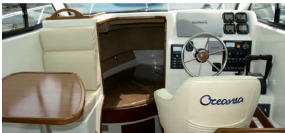
A pesar de que la cabina ha visto reducida su anchura a contar con pasos laterales tipo walkaround, el interior mantiene unas dimensiones satisfactorias.