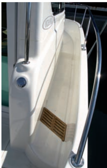
La configuración walkaround de esta nueva Oceania 29 ofrece un paso fácil, cómodo y seguro desde la bañera.

parte, la estética general mantiene su equilibrio, tanto en la relación de manga eslora, como por la altura del francobordo y de la timonera, que no son en absoluto excesivas. Si las versiones Cabin y Center Console destacan por sus bañeras concebidas para la pesca, la 29 WA mejora las intenciones al ofrecer unos pasillos laterales anchos, perfectamente protegidos y respetando la superficie libre en la bañera de popa con el fin de brindar la mayor movilidad a bordo.