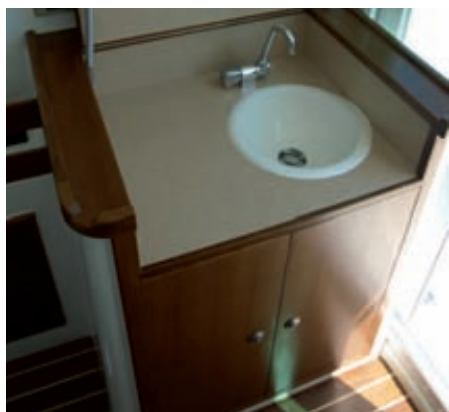
El mueble de la cocina ocupa la parte posterior del asiento del piloto: cajones, armario y fregadero completan el conjunto.