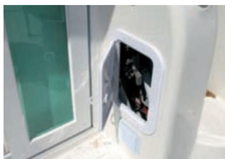
En la bañera, junto a la entrada se encuentran sendos armarios que dan acceso a las instalaciones, aunque se podrían habilitar para guardar objetos.