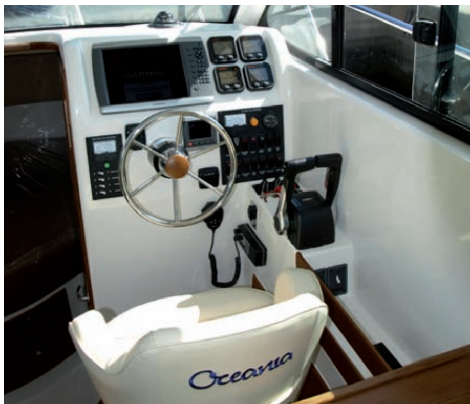
El puesto de gobierno está presidido por la silla monoplaza regulable. La posición ante el volante es cómoda y las palancas se han ubicado en el lugar ideal para ser manejadas con facilidad.

De esta cabina hay que destacar la funcionalidad que ofrece, con un suelo de madera, y otras partes en contramolde de fibra, con acabados en gelcoat en los interiores de todos los cofres, repartidos debajo de los asientos de la dinete y de la litera de proa (dispuesta con la cabe-