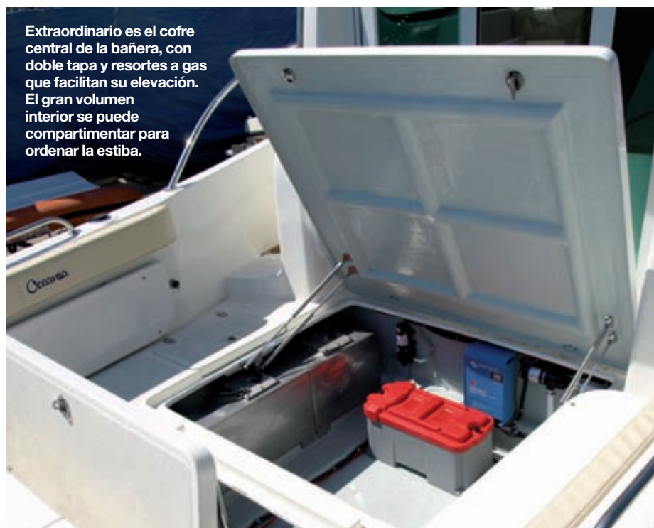
Extraordinario es el cofre central de la bañera, con doble tapa y resortes a gas que facilitan su elevación. El gran volumen interior se puede compartimentar para ordenar la estiba.