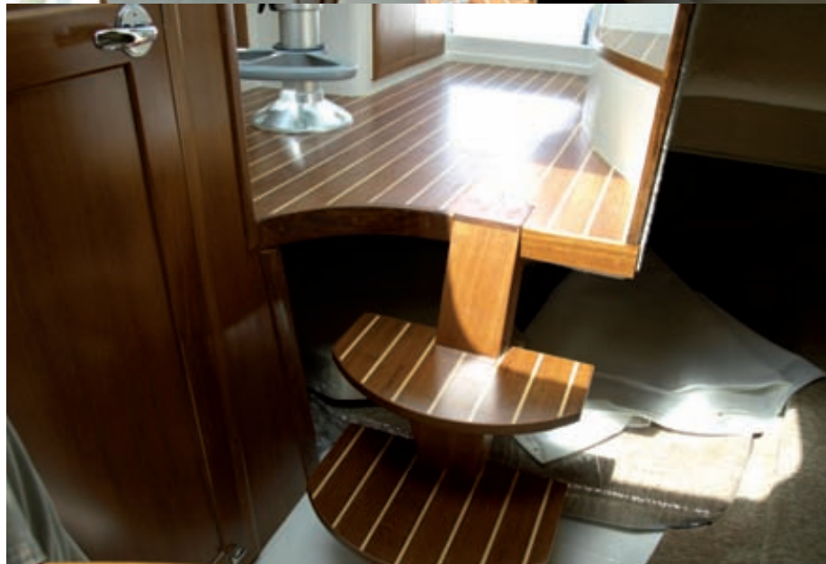
La zona de proa distribuye tres espacios: la litera de proa, la ubicada a media eslora y el gabinete independiente del aseo. La escalera de madera se levanta para facilitar el acceso a la litera de popa.

nada mal para los que van a pescar lejos y necesitan velocidad y precisamente esto: autonomía.