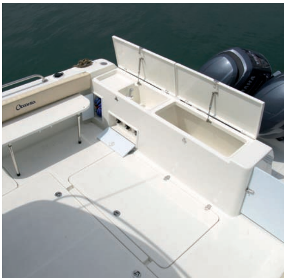
Las dimensiones de la bañera se benefician de la notable manga del barco. No faltan cofres, ni cañeros, ni otros elementos necesarios para la práctica de la pesca.