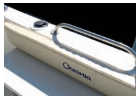
Un buen detalle en la bañera es el pasamanos de inox sobre la regala, que se complementan con los portacañas y los almohadillados interiores.