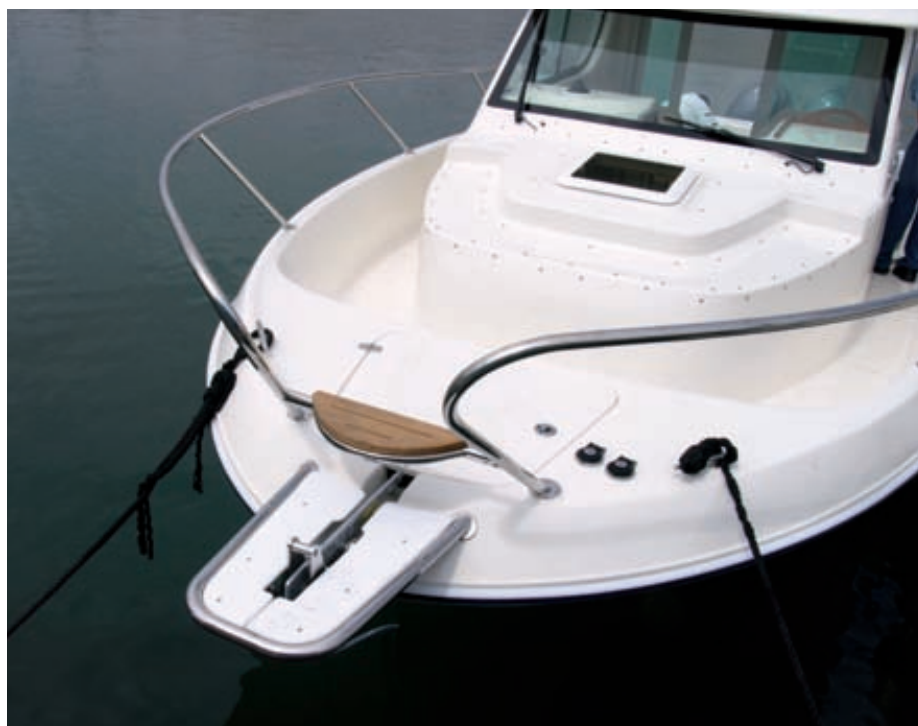
La proa está bien resuelta, con un balcón semiabierto, botalón y un pozo de anclas con molinete.

En la 29 WA se han incorporado varios detalles que mejoran el barco en la bañera: pasama-