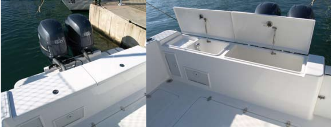
En el espejo de popa se ha previsto un grupo de agua a presión, vivero y lavamanos.

hard top, que no son en absoluto excesivas. La Oceania 27 C destaca por su bañera concebida para la pesca. Beneficiándose de la manga, ha incorporado varios cofres en el piso, dos alargados en los lados y otros dos centrales, que dan acceso a las baterías y a los depósitos de combustible, de aguas grises y de agua dulce.