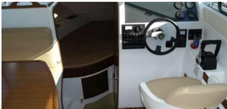
Dos niveles determinan los interiores de la 27 C, el de la dinete y el puesto de gobierno con la cocina, y más a proa el de las cabinas y el gabinete independiente del aseo.

Un buen puesto de gobierno, pues, que permite pilotar a altas