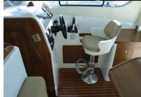
El puesto de gobierno está presidido por la silla monoplaza regulable. La posición ante el volante es cómoda y las palancas se han ubicado en el lugar ideal para ser manejadas con facilidad.