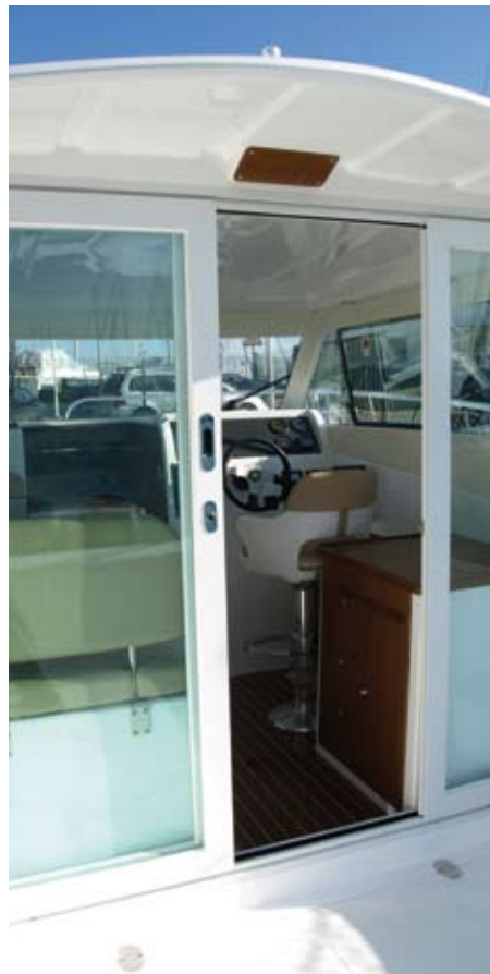
Dos puertas correderas de aluminio lacado en blanco dan paso al espacio de la timonera.