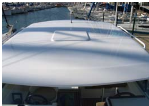
El hard top está preparado para adoptar una escotilla.