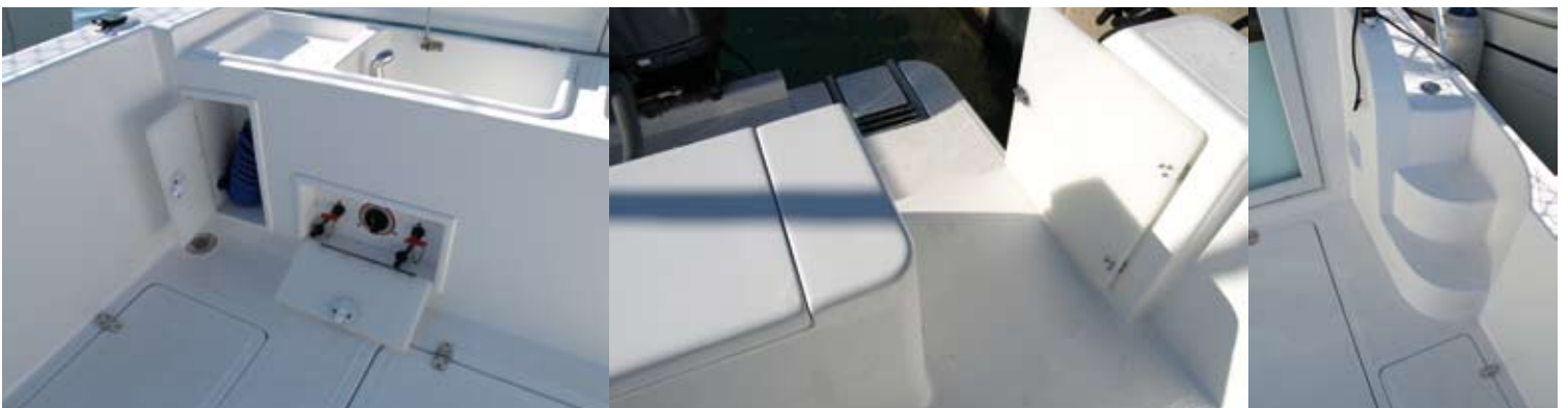
Entre los detalles de la bañera se encuentran los pequeños armarios para la manguera de baldeo y los desconectores de baterías, además de una puerta de acceso directo a la plataforma o los escalones integrados que conducen a los pasos laterales.