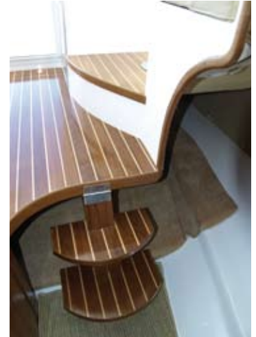
A media eslora, bajo el suelo de la timonera, se encuentra la litera transversal. La escalera se levanta para facilitar el acceso.