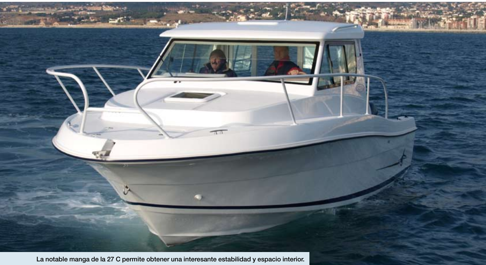
La notable manga de la 27 C permite obtener una interesante estabilidad y espacio interior.

La empresa distribuidora de esta marca, JJ Nautic, de El Masnou, en Barcelona, es la responsable de esta primera unidad de la recién presentada de la Oceanía 27 C, la versión con timonera de una de las carenas más logradas para la pesca deportiva en esta eslora.