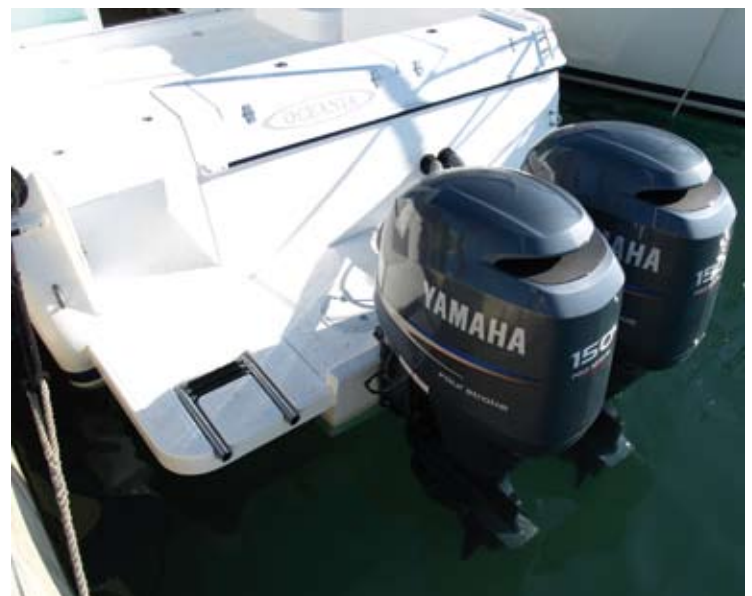
Uno de los puntos fuertes de este conjunto es el montaje y la buena adaptación de los dos Yamaha F150 a la 27C.