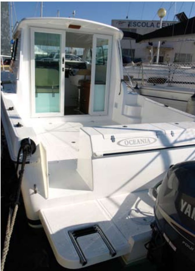
A pesar de los dos Yamaha F150 queda espacio libre en la plataforma de popa para los aficionados al baño.

En general, exteriores muy bien resueltos para una fisher de esta