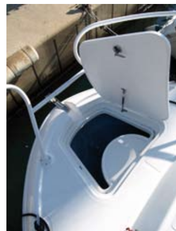
La proa cuenta con un buen pozo de anclas y la correspondiente roldana.

Una de las características de la 27 C que salta a la vista es su notable manga. Nada menos que tres metros en un barco con una eslora total de casi 8,90, proporciona una amplitud al límite, pero sin romper su proporcionada imagen. Es decir, que la estética general mantiene su equilibrio, tanto en la relación de manga eslora, como por la altura del francobordo y del