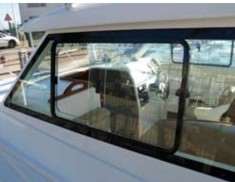
Los laterales, con correderas de metacrilato, incrementan en la ventilación de los interiores.

eslora: espacio, buenos acabados en fibra, antideslizante grabado en toda la cubierta, imbornales bien dimensionados, y un equipamiento de serie correcto, donde figuran varios elementos que agradecerá el pescador.