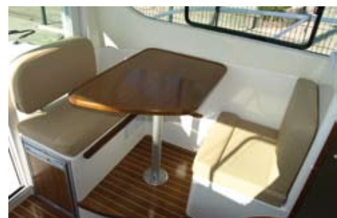
La dinete es convertible en una litera bajando la mesa. Debajo del asiento de popa se ha colocado la nevera eléctrica.