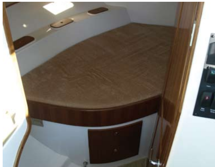
La litera de proa tiene la cabecera en la amura de babor para aprovechar mejor el triángulo disponible. Cajones a los pies de la cama, cofres debajo y pequeños huecos con tapa que rodean la amura, completan el conjunto.