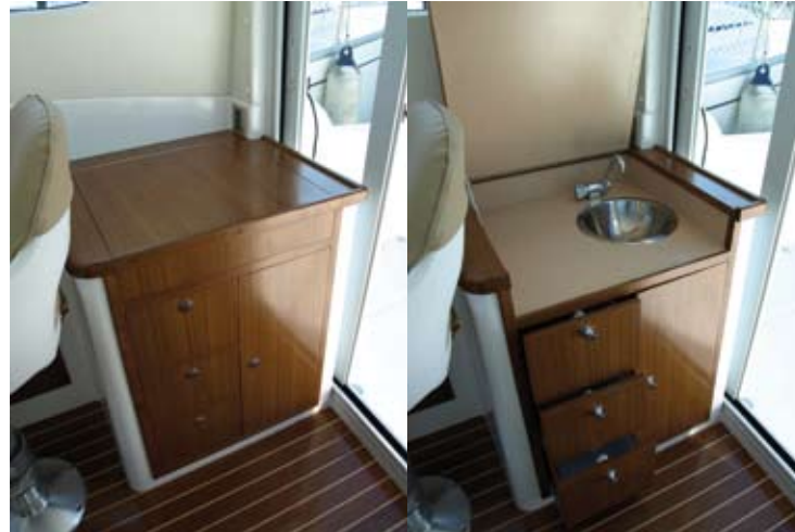
Dos vistas del mueble de la cocina: cajones, armario y fregadero de inoxidable.

En cuanto a opciones, el astillero ofrece el pack De Luxe, que cuesta tres mil euros, pero incluye el car-