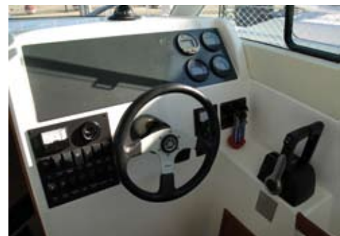
La consola deja un amplio espacio para añadir una pantalla multifunción en el centro.