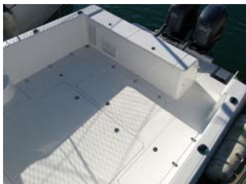
Las dimensiones de la bañera se benefician de la notable manga del barco. No faltan cofres, ni cañeros, ni otros elementos necesarios para la práctica de la pesca.