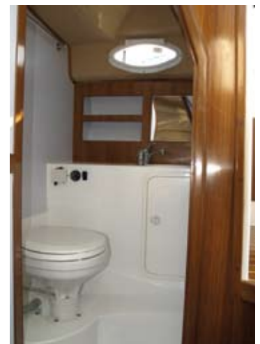
El aseo es sorprendentemente grande para este barco. El contramolde de fibra se combina con los detalles del mobiliario en madera.

gador de baterías 220V/12V-20Ah, el mobiliario interior en teca, un WC eléctrico con macerador de 12 V, el depósito de aguas negras de 50 litros, la bomba vivero y la ducha de agua dulce en la bañera. No obstante, resulta obvio que el depósito de aguas negras es obligatorio, por lo que debería separarse de este pack.