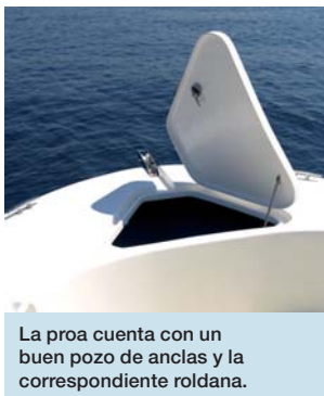
La proa cuenta con un buen pozo de anclas y la correspondiente roldana.

de destacar por su bañera bien concebida para la pesca, llama la atención por los diversos cofres repartidos en el piso, dos alargados en los lados y otros dos centrales, que dan acceso a las baterías y a los depósitos de combustible, aguas grises y agua dulce. Además, en el espejo de popa se evidencia el carácter fisher de este modelo, puesto que no faltan un vivero y un lavamanos con agua a presión. La puerta de acceso directo a la plataforma de popa, con su correspondiente escala de baño integrada en el molde y la ducha, son elementos que agradecerán los amantes del baño.