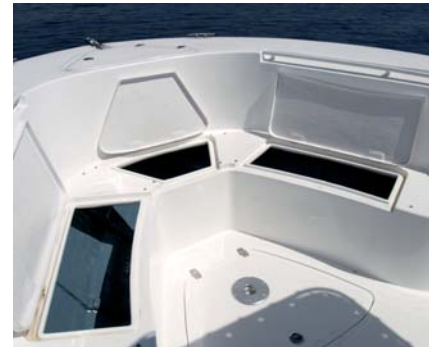
Como es natural, bajo los asientos de proa los huecos se convierten en cofres de estiba muy útiles.

La buena manga de la 27 CC permite obtener una interesante estabilidad y una enorme bañera en popa, bien adaptada para la pesca.