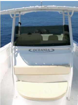
La parte delantera cuenta con un asiento que puede complementar la dinete de proa.