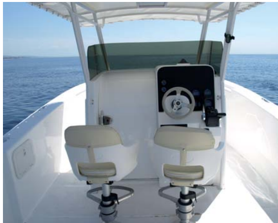
El puesto de gobierno está bien concebido. Es cómodo y ofrece una perfecta visibilidad.