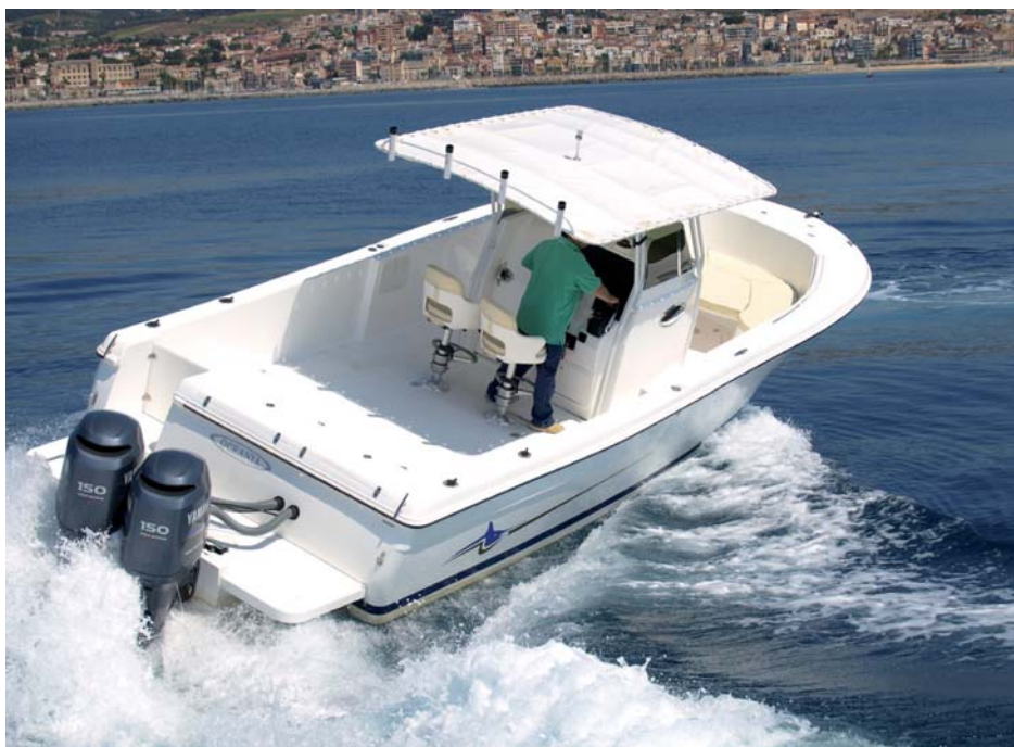
Estable, rápida y muy maniobrable, así es esta nueva Oceania 27 CC.

La primera Oceania 27 CC presentaba una serie de detalles que se modificarán en las siguientes unidades. Dada su configuración abierta, resulta un barco más ligero que la 27 C, en torno a unos 250 kilos menos, por lo que la distribución de los pesos debe modificarse, en especial la ubica-