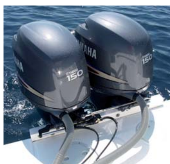
Uno de los puntos fuertes de este conjunto es el montaje y la buena adaptación de los dos Yamaha F150.

WC eléctrico con macerador de 12 voltios, el depósito de aguas negras de 50 litros, la bomba de baldeo / vivero, y la ducha de agua dulce en la bañera con depósito de 60 litros. Un barco,