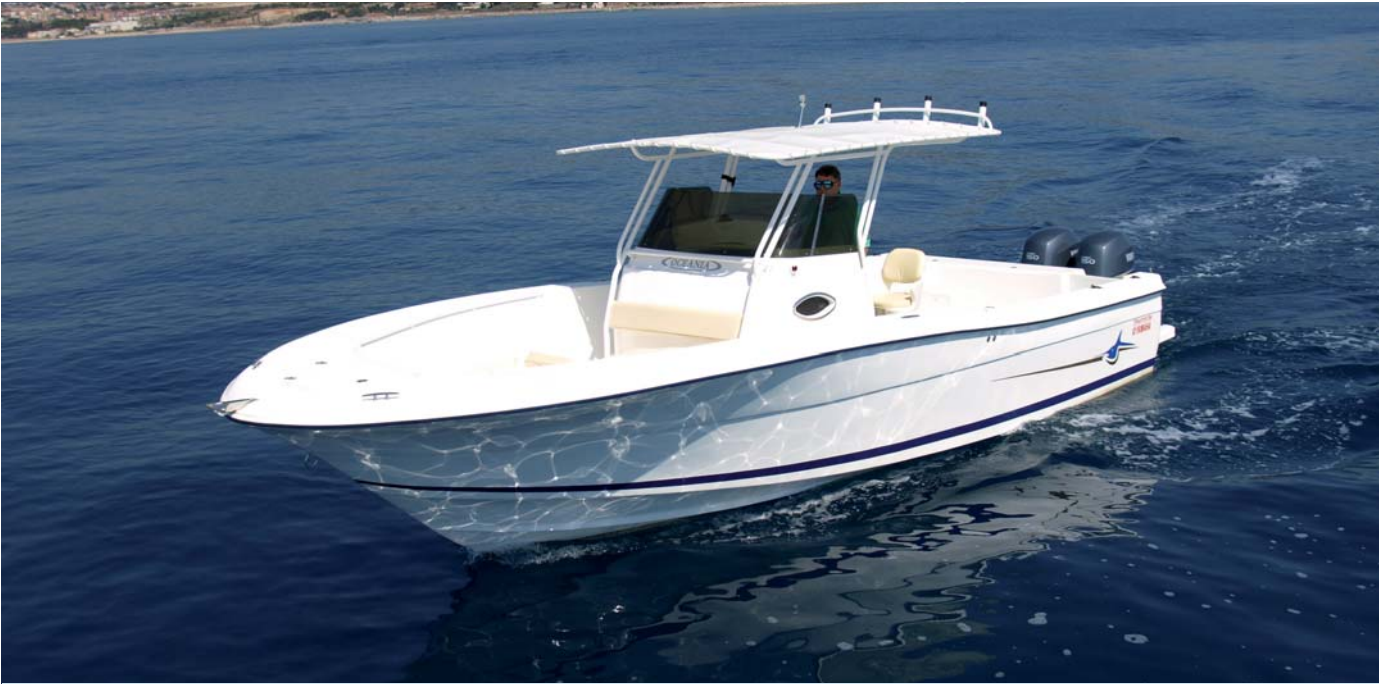
De afinadas líneas en proa, esta eslora de menos de ocho metros fiscales, muestra una imagen elegante y deportiva.

Y en la parte inferior del espejo de popa, a estribor, dos pequeños armarios protegen los desconectores de baterías y la manguera de baldeo con agua a presión, lo que pone de manifiesto el cuidado aplicado a este producto. Los cañeros en las bandas vienen de serie.