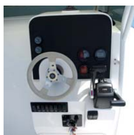
En el panel hay espacio para una pantalla multifunción y los indicadores de los dos Yamaha. Las palancas, bien ubicadas, son muy cómodas en su manejo.

Otro punto a considerar es la entrega de serie del Pack de Luxe (valorado en 4.550 euros), y que incluye el T top de inoxidable, el