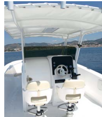
El soft top, sostenido por una robusta estructura de inoxidable pintado de blanco, se sustituirá por un top rígido y con la estructura de inox cromada, sin pintar.