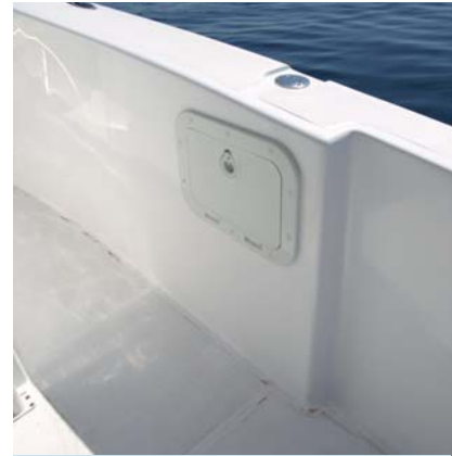
Los detalles son numerosos en este modelo, como este registro en el costado, a media eslora.