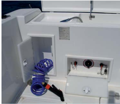
Dos pequeños armarios protegen los desconectores de baterías y la manguera de baldeo con agua a presión, lo que pone de manifiesto el cuidado aplicado a este producto.