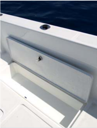
Los lados del piso de la bañera están ocupados por cofres con cubetas para la pesca.