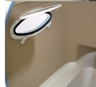
Dos vistas del interior de la consola, con el inodoro, un cofre y los portillos de ventilación.