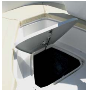
El aprovechamiento de los espacios en la 27 CC es total. En el piso de proa un gran cofre puede guardar pertrechos grandes.

En lo que respecta a la ergonomía del puesto de gobierno la Oceania 27 CC hemos de apuntar que es un barco que se gobierna bien de pie, por lo que convendría sustituir los dos asientos individuales por un banco alto, todo en una pieza de fibra, dejando espacio debajo para colocar una nevera. Y esto es lo que justamente vendrá en las unidades futuras de este modelo de la 27 CC.