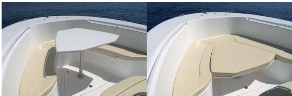
El triángulo de proa se puede transformar en dinete o en un solárium que ocupa prácticamente toda la superficie delantera.